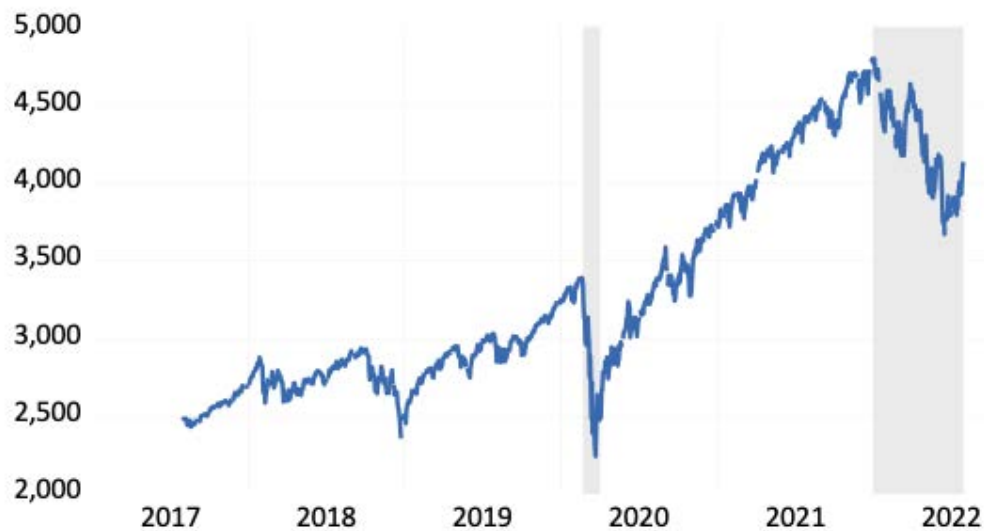
Gráfica 1 Índice Standard and Poor's del Mercado Accionario 2019-2022

Fuente: S&P Dow Jones Indices LLC, accesado en FRED, Federal Reserve Bank of St. Louis (Julio, 2022)